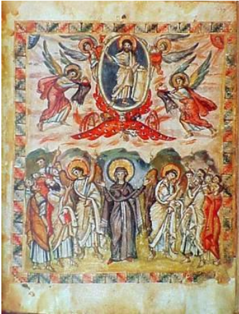
L'Ascension, miniature sur un évangélaire, codex de Rabula, Fol 13v, VI e siècle

C'est Eusèbe, évêque de Nicomédie, qui la mentionna pour la première fois comme une fête particulière.