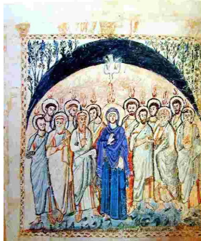
La Pentecôte, miniature sur un évangélaire, codex de Rabula, Fol 14v, VI e siècle

Ô lumière bienheureuse, viens remplir jusqu'à l'intime le cœur de tous tes fidèles.